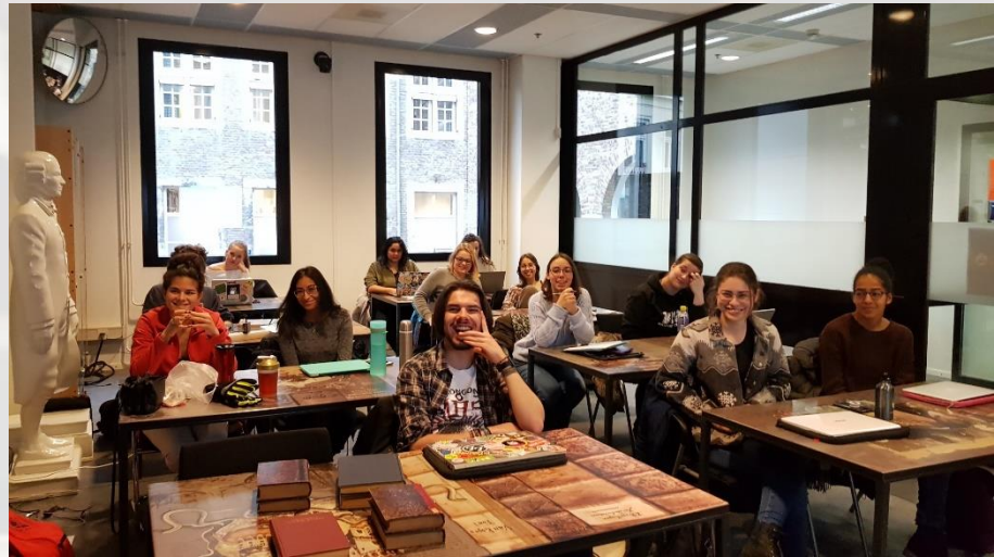
CCO File:Maastricht-course 2019 - Opening up old books (1).jpg