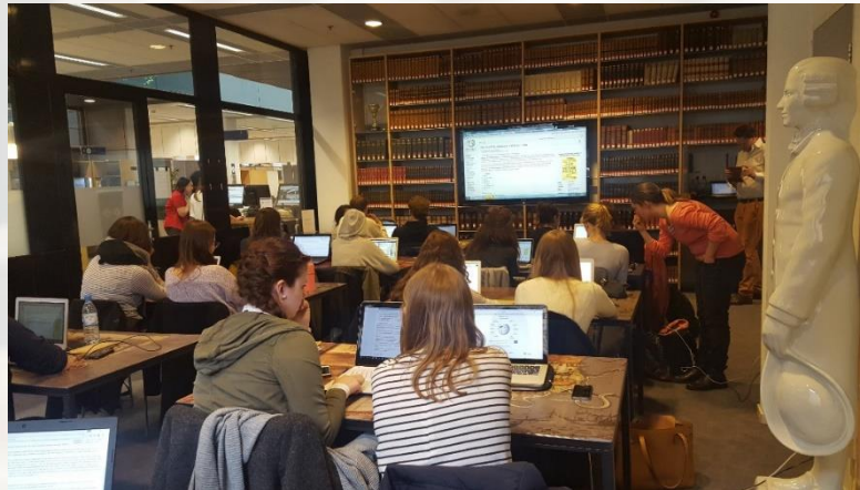
CC0 File:Wikipedia course at Maastricht University College, FPN Historical Book Review, 3 May 2017 (2).jpg